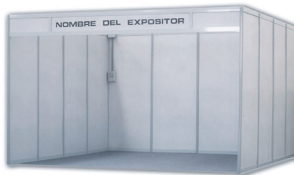
Ejemplo de espacio construido